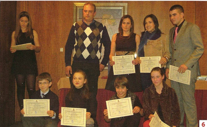
1. Entrega de los diplomas de equipos.